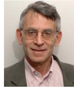
Prof. Abraham Aviv

La Société Internationale d'Hypertension 2010 vous invite à participer et à interagir avec les experts du domaine cardiovasculaire sur le risque cardiovasculaire global et ses conséquences sur l'atteinte des organes cibles. Afin de consulter le programme scientifique ou pour obtenir plus de renseignements sur les principaux symposia, cliquez ici .